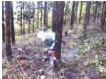
大分空いてきた林