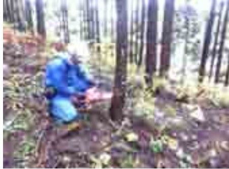
この林はトビグサレが少ない