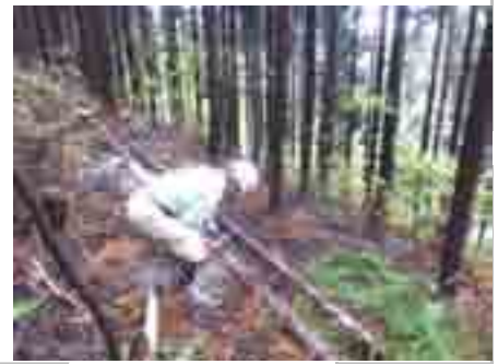
葉枯ししていた伐倒木を丸太に