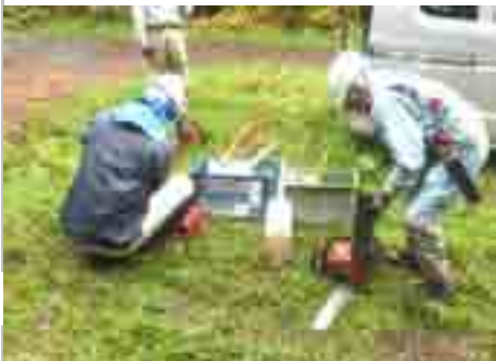
先ず、燃料、オイルを充填

□ 10/26 間伐 台風の直撃は免れたが、雨模様の中で作業。参加9人。 雨水を含んだスギ林の作業は足元が滑りやすく要注意。