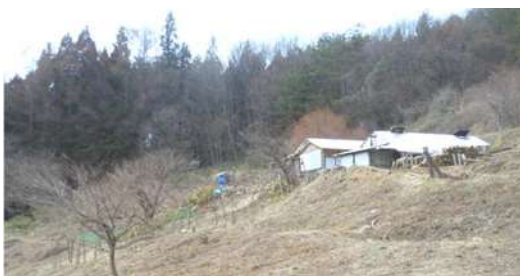
ギダジ研修場……雪も消え、みんなの来るのを 待っています (3/28 撮影)

昨年度と同じ。「講座」、「炭焼き」「木工」… など森林ライフを満喫してください。