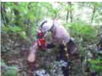
マツ造林地だがかなり雑木も……