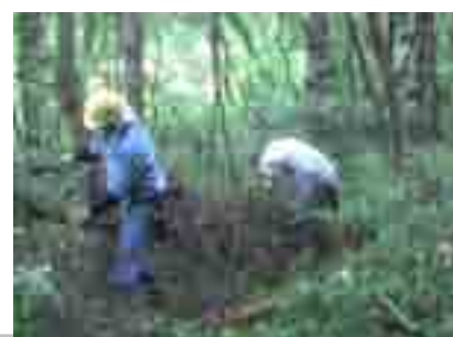
雑木、灌木、ブッシュだらけ