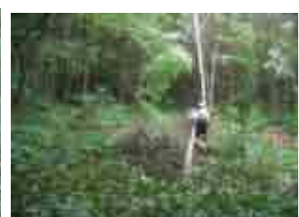
いっそ、雑木林に誘導したほうが……