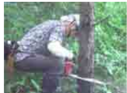
先ず、マツの枯損木の処理