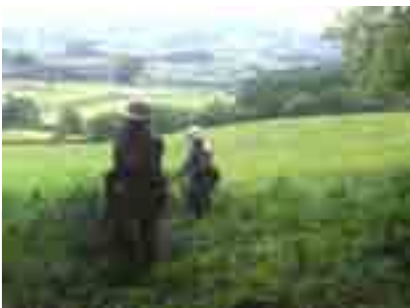
周囲は牧歌的なロケーション