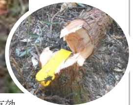
小径木の伐倒にはガターカットが有効