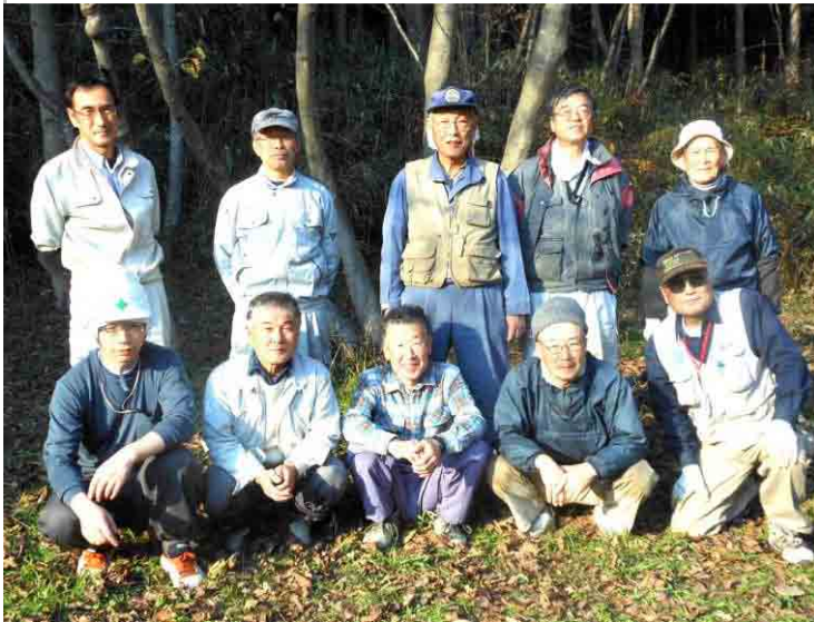
この秋最高の小春日和 参加者 11人(1人はカメラ掛り)