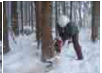
寒さの中奮闘する精鋭達です

* 12月22日～26日、花巻市の委託事業を行いました、新花巻駅から1kmほどの清掃事業所南側です(焼却場が相性が良い)、松の林です、被害が著しく殆ど松が枯れて白骨化してます、水田淵の危険な木を安全確保の為に伐採して行きました、対象の木は126本を数え他の障害となる樹木も含めると300本くらいになると思います。安全確認し水田には影響が少ない様に協力して作業を行い、予定していたの66本を処理することが出来ました、残りは3月までに行います。