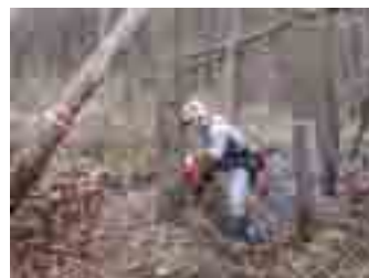
大木に果敢に挑戦してます!