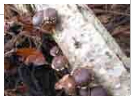
山の恵み…毎年 こちそうさん！