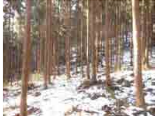
今冬は雪が少なく消えるのも間近 2/26