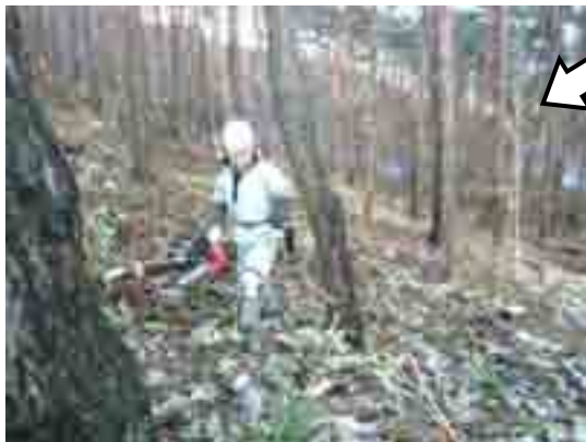
端が見通せるようになったマツ林 12/1