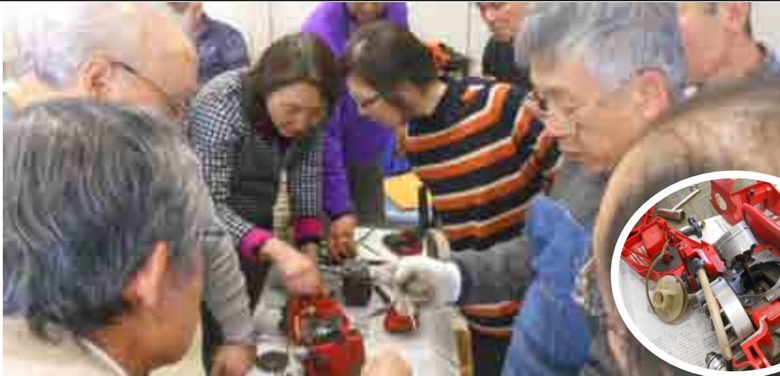
は〜ん！ こういう仕掛けか、2 サイクルエンジンは小型でも馬力は強力……チェーンソーの分解 (2/16 講座)