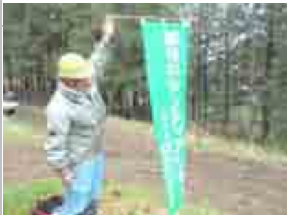
4/27…旗を掲げて活動開始