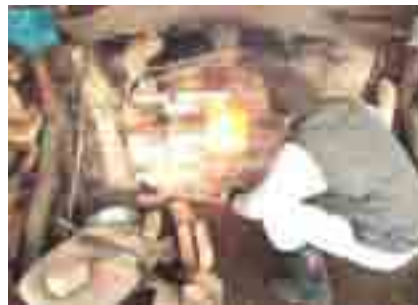
炭焼き……自前の炭窯を造って5年目。難しいスギの炭焼きもだんだん精度が上がってきました。炭の用途は広いです