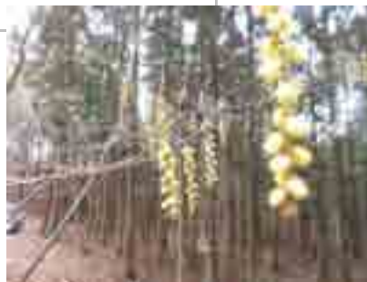
早春の花木“キブシ”が迎える