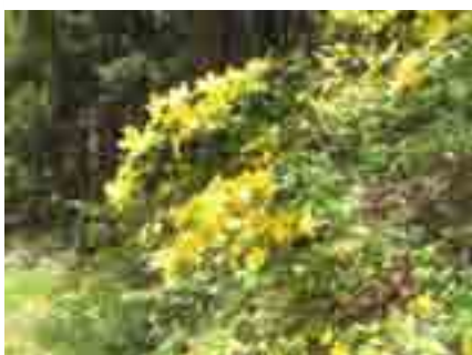
黄色が映える山吹(ヤマブキ)の花