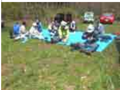
4月下旬でしたが野外で昼食