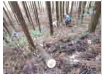
(昨秋) 葉枯らし処理した間伐材