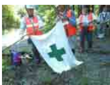
8/25・朝一番、安全旗の掲揚から