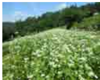
今年は花の付きが良い