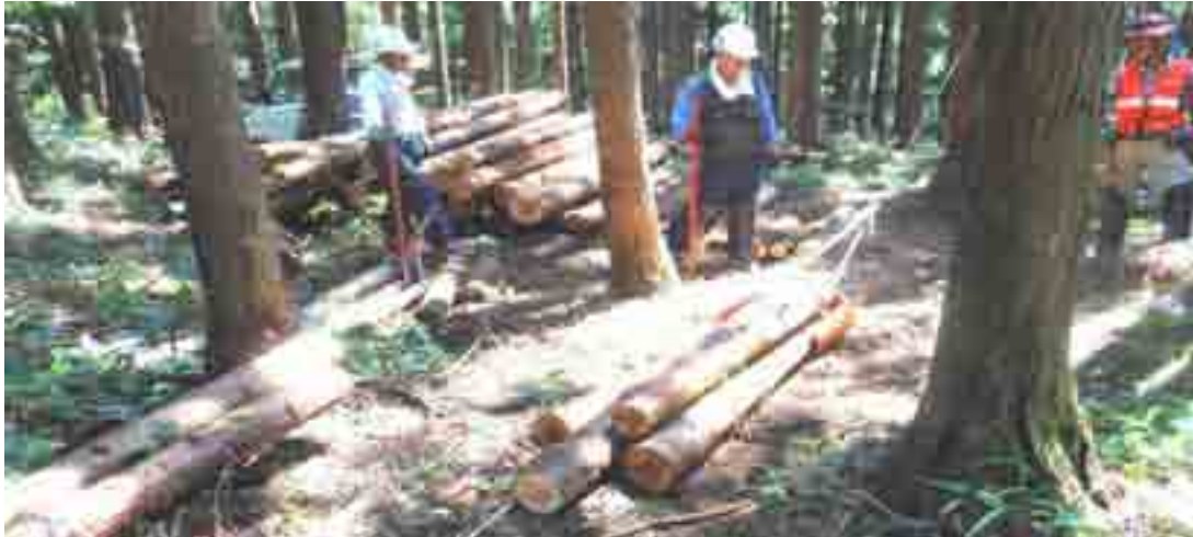
動力（ウインチ）での集材・・・生木は重い！でも、動力使えば容易にできます（8月の「講座」から）