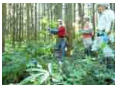
伐木、先ず伐倒方向を決める