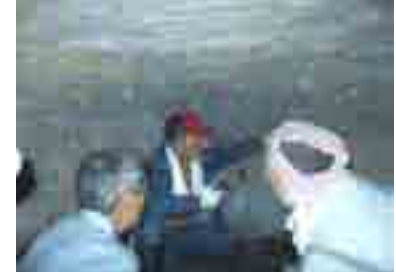
窯内に入って補修箇所の点検