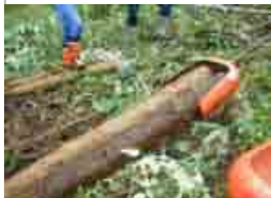
8/10……動力ウインチで集材