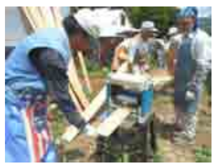
アカゲラの巣箱づくり・カンナ掛け