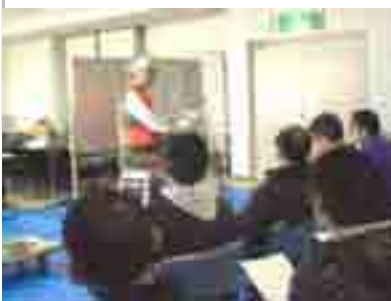
目立てのポイント解説