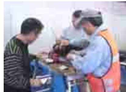
初めは窮屈ですが……