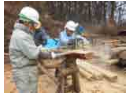
2種の簡易製材機で挽く