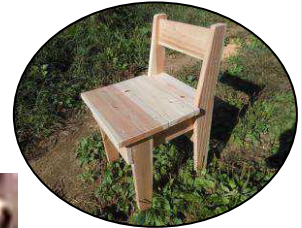
間伐材から作成した木工製品