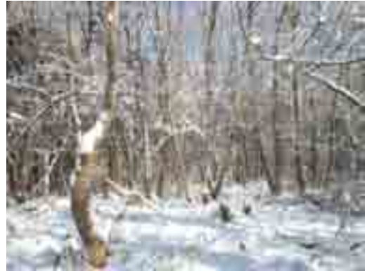
冬の雑木林(12/14)……盛岡市手代森地内

＜雑木林＞落葉した雑木林は明るく、梢の先まで見えて枝葉のつき方が分かります。また、低木などの冬芽も観察できます。