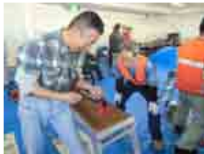
「先ず、刃の形を整えて……」