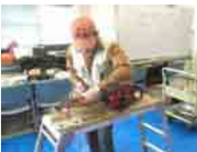
研ぐ姿勢は Good です