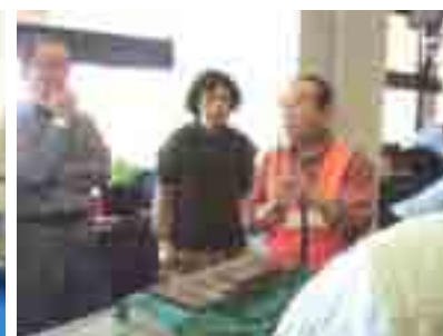
ナタの研ぎ方にも理屈あり