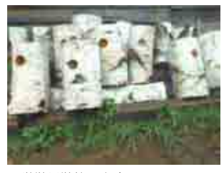
営巣用巣箱も完成