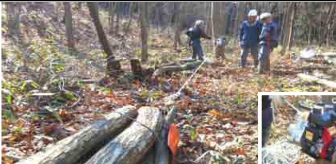
使い勝手は Good・・・ロープウインチでの集材体験学習（林野庁・森林空間利用タイプ事業）