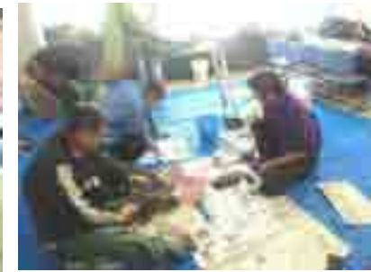
台所の包丁も研げます