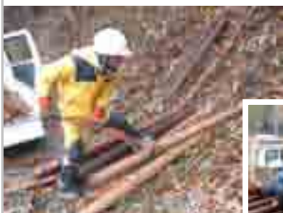
運材は資源化の第一歩!