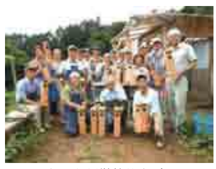
8 月・ねぐら用巣箱仕上げる