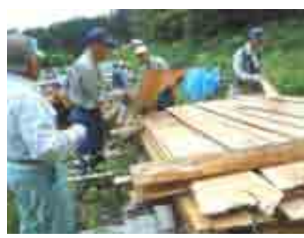
5 月・間伐材で挽いた板