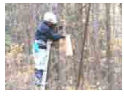
10~11 月・巣箱掛け 盛岡市新庄墓苑、動物公園、つどいの森に:合計 33 個の巣箱を取り付ける