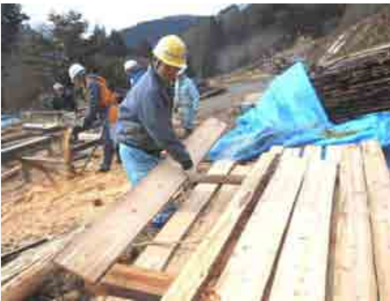
丸太(スギ丸太)を板に挽いて資源化……木工の材料などに

□ 12/7, 「製材」「運材」・スギ間伐材を挽き板に、丸太運び~ 参加 計18人