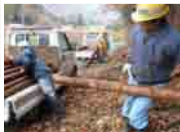
軽トラが活躍……雪が降る前に急いで運び出す