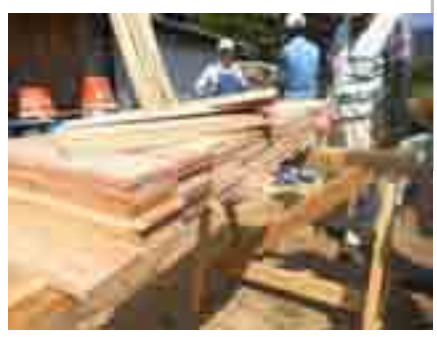
巣箱の材料は揃った