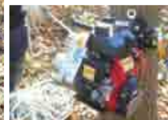
ロープウインチの駆動エンジン