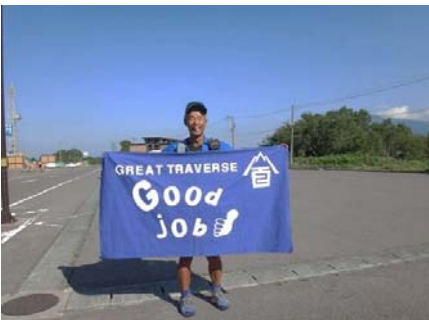
わが故郷の和賀岳頂上！