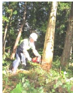
赤松の被害は甚大!