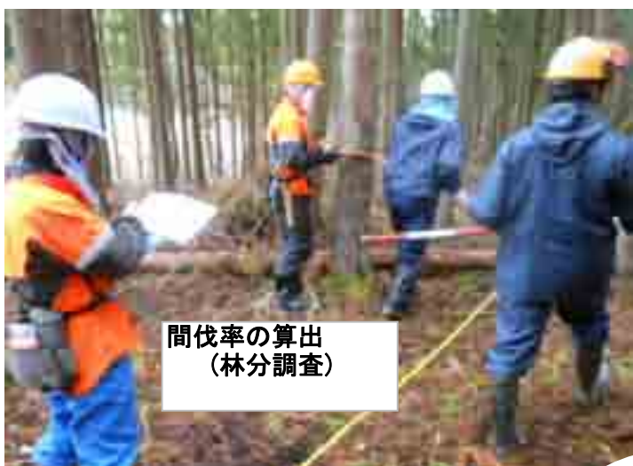
間伐率の算出 (林分調査)