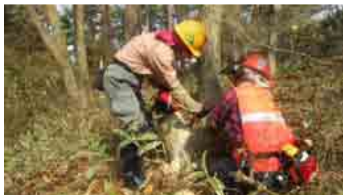
堅くて裂けやすい広葉樹の伐木……よし、これでやりましょう！