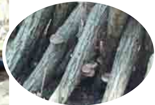
間伐材の利活用……きのこ栽培(シイタケ、ナメコ)植菌作業 (4/26) 去年植菌した-ほだ木にシイタケが！！！！