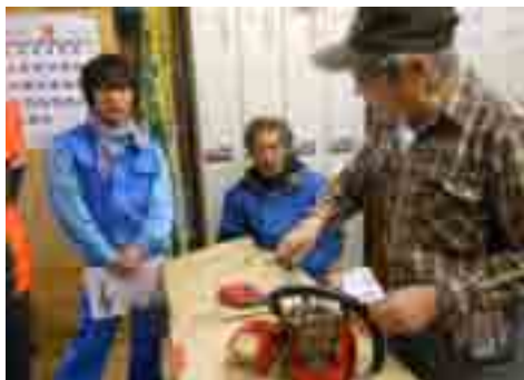
分解して構造を知る