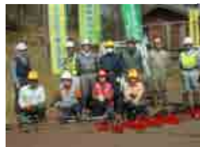
2日目朝の集合写真