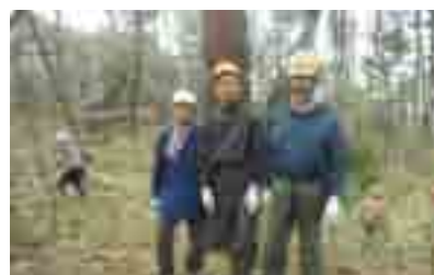
地元、「吉里吉里国」のメンバー

□ 4/18～19 大槌の「筋山」は標高200mでも眺めはリアス式海岸美が眼下に広がるビューポイント。今回の活動は観光施設のある筋山の整備が狙い。研究会、みちのく郷山保全隊、間伐ボランティアいわて、いわて森林を守る会、それに現地のNPO法人吉里吉里国と5団体の合同で進めました。参加は2日間で延べ30人。きつい斜面と樹木の大きさに若干手を焼きましたが、なんとか目的を果たしました。