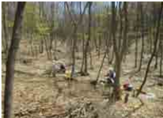
明るい雑木林、昨秋、伐倒していた材の集材