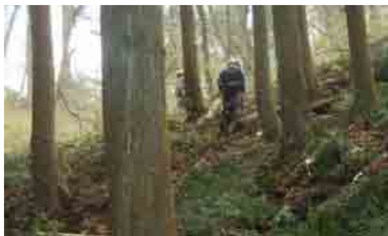
急斜面のスギ林、樹高も27, 28メートルと高い！