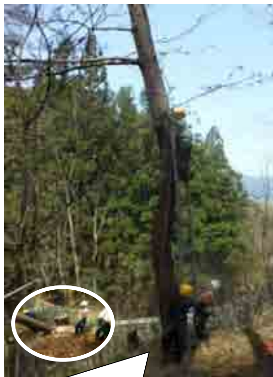
偏心のマツ大木、ハシゴ、ひっぱりだこも使い慎重に処理