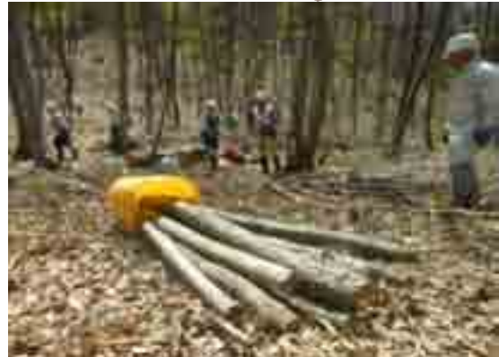
100mのロープウインチは頼もしい