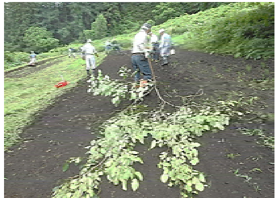
去年の種まき風景……枝葉で覆土