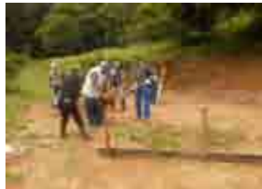
測量して掘立柱の穴を掘る