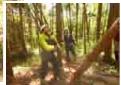
掛り木? ドンマイ、ドンマイ!