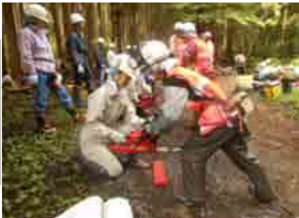
ハンドルの握る位置に気をつけて

□ 6/13(土), 24(日) 「講座」…参加 6/13…43人 6/28…36人 チェーンソーワークの基本、小径木の伐倒、補助具の使い方