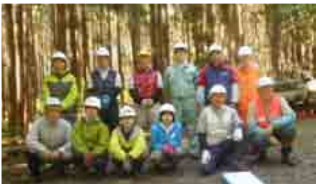
社会人と大学生の混成で研修

□ 6/7(日) 里山・教育研修 三助山 参加 12人 (スタッフ3人) 研修 2回目でもう伐木。