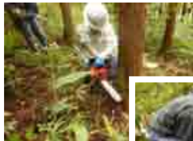
チョットと猫背だよ