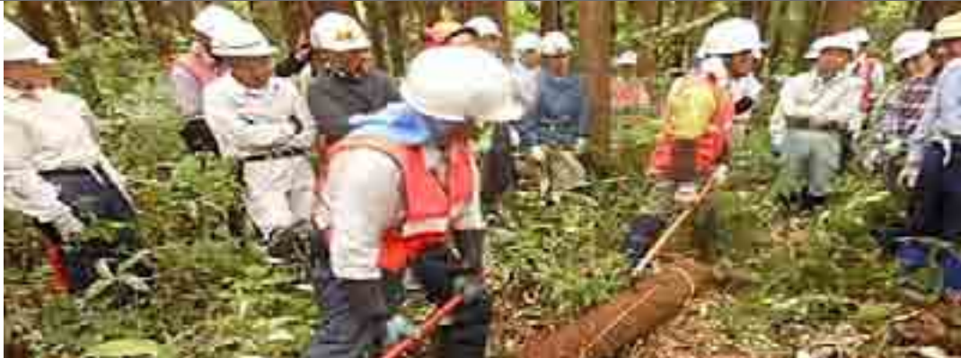
トビロの打ち方にも作法がありますヨ……アマチュアの味方「補助具」の使い方 (6/13 講座)