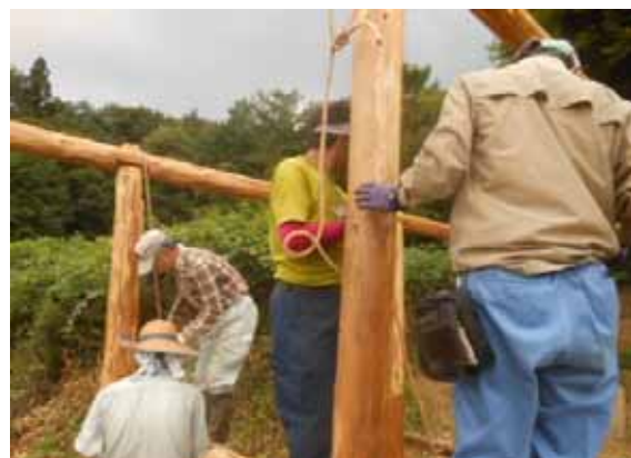
梁を組み込んだ柱は重くて大変、ウインチ、滑車、ロープ、ハシゴを駆使して立ち上げる