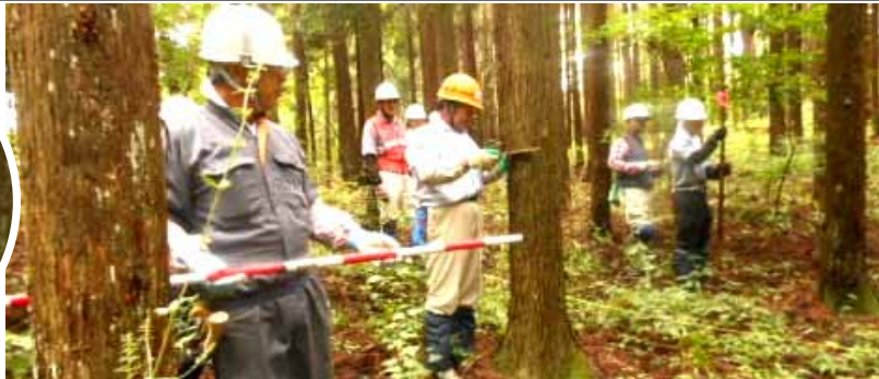
この林の間伐率を知る 立木の本数と樹高が分かれば「間伐率」は計算するだけ！ 超簡単な林分調査 (8/23 講座)