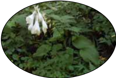
オオバギボウシ (ウルイ)