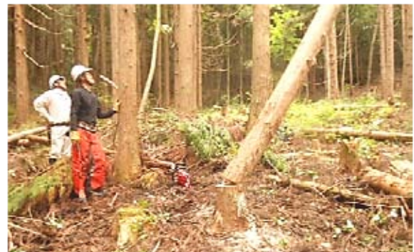
掛り木でガッカリしないで、教材です