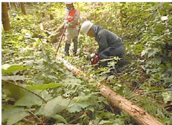
枝払いも作法(チェーンソー操作)があります