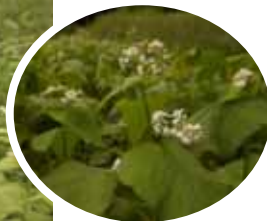
花が咲いたそば畑 (8/28)