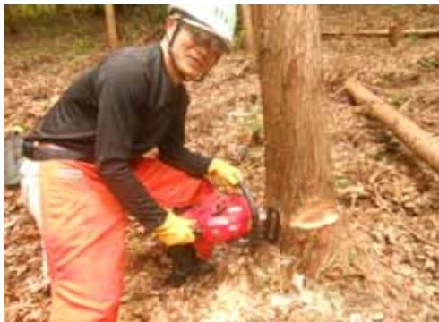
ちょっと足を広げ過ぎ、でも会合線はピッタリ合ってます