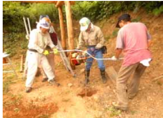
威力発揮の手づくりの穴掘り機械