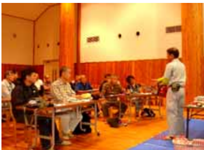
雨降りとなり、室内研修