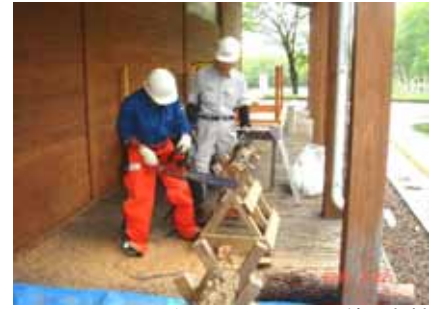
初めてチェーンソー使う女性