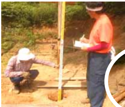
測量機器を使ってで正確に穴の深さを調整