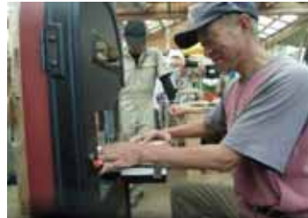
昨年度の木工教室