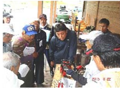
実技は建物の庇の下で”目立て”