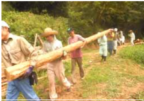
エッサ、エッサ 6mの梁材を運ぶ