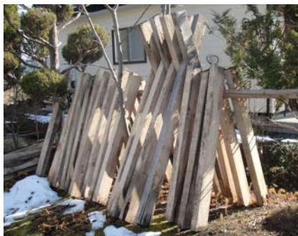
丸太を製材して、野外乾燥

また、都合で参加できない同僚のため、二足三足と仕上げを頑張った人もあり、思う気持ちに触れた1日でした。