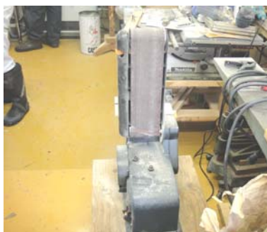
使用木工機械の一部