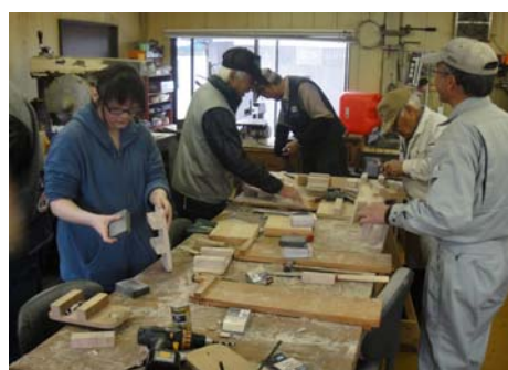
鋸目入れの部位を取り除き、角取りと面取りして研磨仕上げ