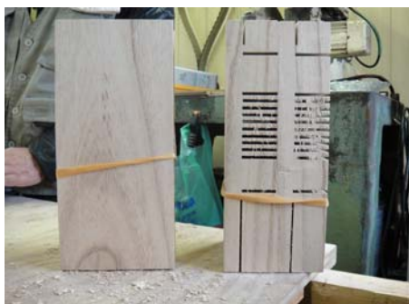
製材物から、規格サイズに木取り除く部分に鋸目を入れ乾燥したパーツ