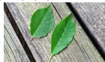
(左)ウワミスザクラ (右)イヌザクラ