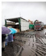
雨の中 チップ製造設備