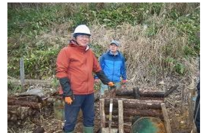
ドラム缶炭窯の準備