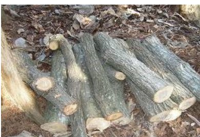
ほだ木に広葉樹伐倒