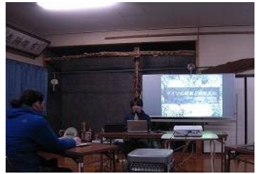
会員の海外視察講話