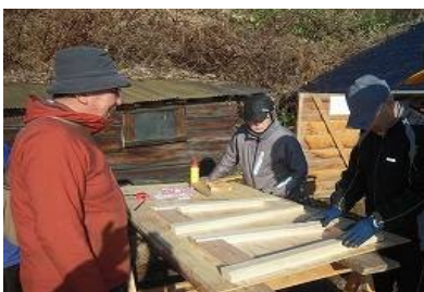
木製デスクの試作検討