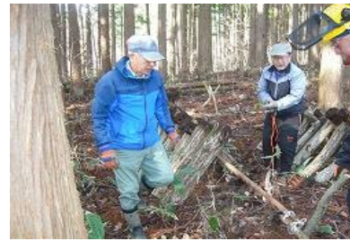
キノコほだ木の天地替え