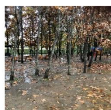
④公園内 保育所園庭