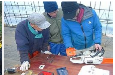
チェーンソー整備