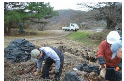
畑土づくりに放置材集め