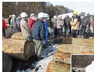
盛岡木材流通センター見学