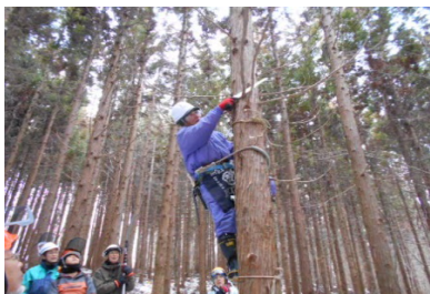
ハシゴを使った作業