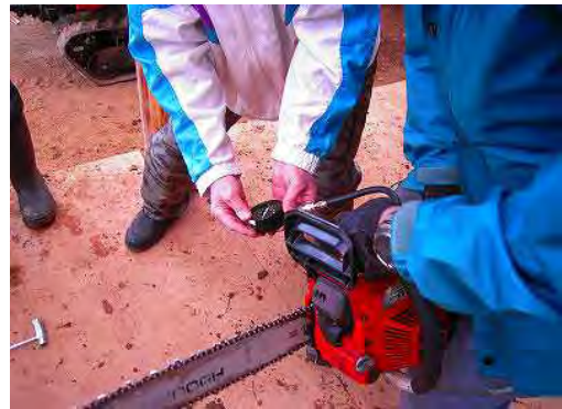
持ち寄ったチェーンソーの機能を点検中。

初めにキャブレターの調整ねじが何回転に調整されているかを記録。その後にプラグスパーク能力を確認、次に圧縮圧力を、最後にアイドルリングと最高回転数を測定しました。