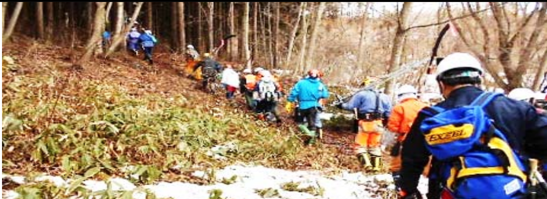
スギの枝打ち研修……現場に向かう受講者の列、登り15分の坂道は準備体操？（森のチェーンソー講座3/10）