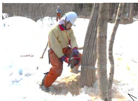
追い口を切り進めたら突然