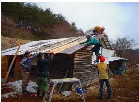
小屋屋根の破れもふさいで修理しました