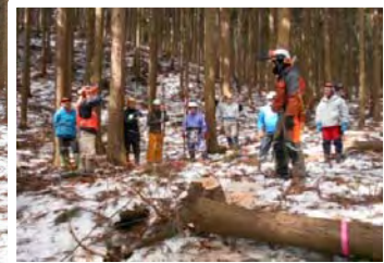
これが一年の成果です。