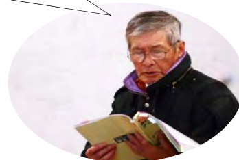
振動障害の知識・予防、 また安全衛生規則など関係する法令を学習

チェーンソーを購入する時は 3 軸合成値のラベルを貼ってあ るのを選びましょう ..