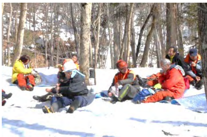
天気晴朗 雪白し、雪上の昼飯は格別の味