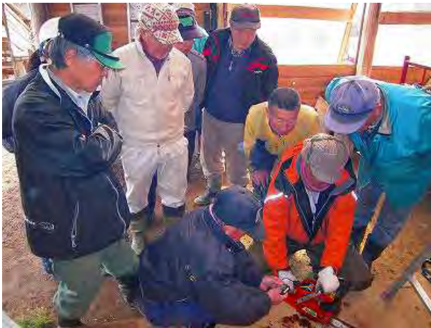
他人の機械の調子はだれもが気になる様子

チェーンソーの健康診断とキャブレター調整、そして、冬の積雪で傷んだ作業小屋の屋根を修理しました。