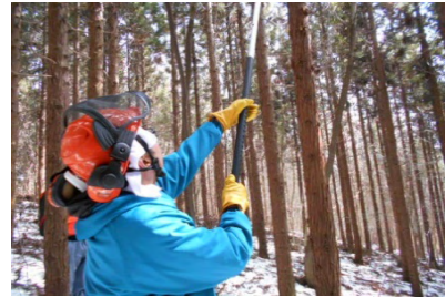
高枝ノコは首が疲れる