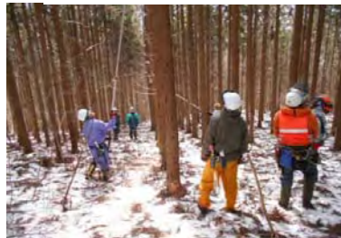
枝打ちしていないスギ林……枯れ上がった枝がビッシリ