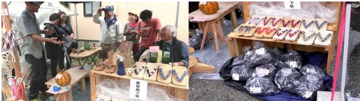
自分たちで伐った間伐材をイス、下駄、炭に加工して販売配布。地道な活動がコンクール受賞につながりました。

ホームページ: http://i-sinrinsaisei.org/ ブログ: http://iwatesinrinsaisei.sblo.jp