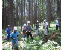
林分調査で間伐率は？