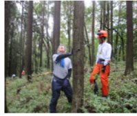
偏心は？、伐倒方向は？