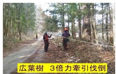
広葉樹 3倍力牽引伐倒