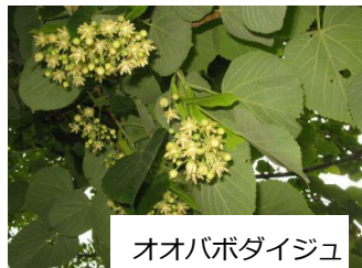
オオバボダイジュ