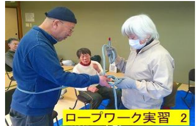
ロープワーク実習 2