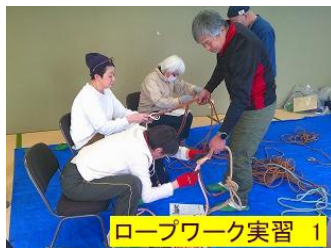
ロープワーク実習 1