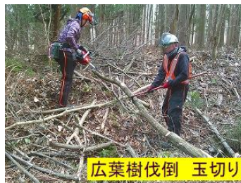
広葉樹伐倒 玉切り