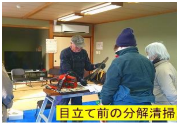
目立て前の分解清掃