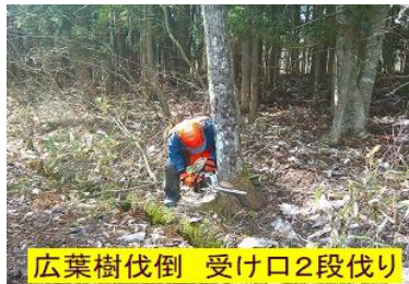
広葉樹伐倒 受け口2段伐り